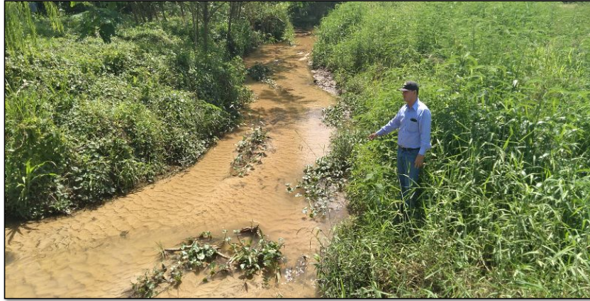
FOTOGRAFÍA N°01: SE VISUALIZA LA COLMATACION CON SEDIMENTOS