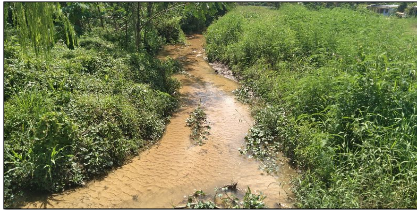
FOTOGRAFIA N°02: EN EPOCAS DE MAXIMAS AVENIDAS AFECTA A MALECON DEL DISTRITO